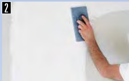
2 Oberfläche nach schleifen