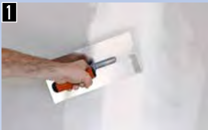
1 Prima Fertigspachtel Fine auf Null ausziehen