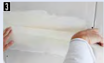
3 Papierbewehrung einlegen