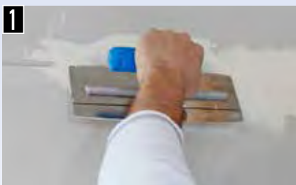
1 Fuge mit Prima Fertigspachtel Fill & Fine füllen