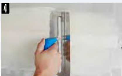
4 Papierbewehrung abziehen