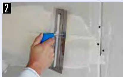
2 Spachtelbrett vorlegen